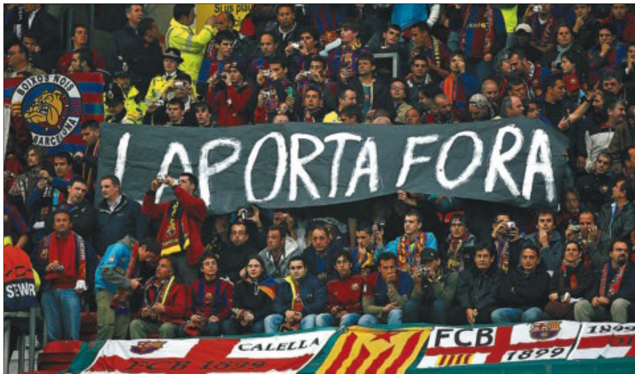
Forófos culés en el partido de vuelta de semifinales entre el Manchester y el Barça.