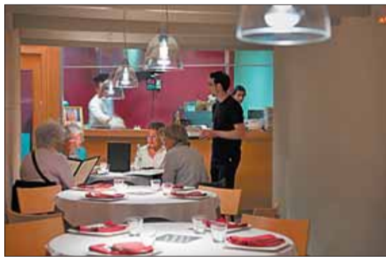
El restaurante La Mifanera.

Tras pasar por las cocinas del Talaia y Comerç 24, Roger tuvo claro que quería convertirse en un astronauta gravitando las 24 horas alrededor de un planeta en forma de grano de arroz. En Barcelona, en la que el grano de las paellas o los arroces caldosos suele servirse con el esqueleto reventado, la aparición de un restaurante que mima la