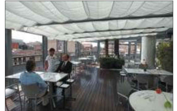
Restaurante La Terraza del Claris.

Leída la carta, la propuesta culinaria del local, al igual que la bossa que acariciaba los tímpanos de los comensales, evidenciaba que iba dirigida a un públi-