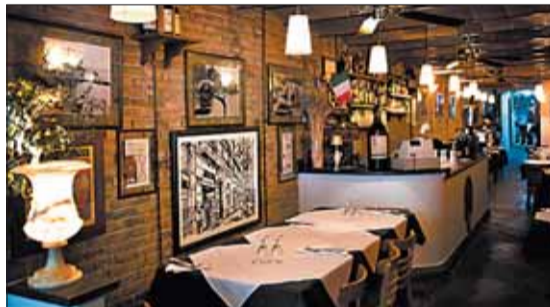
Non solo pizza es un susurro de Italia.

La carta de Non solo pizza tiene el mimo de la Liguria, pero sus platos no son exclusivos de esa zona. Entre sus delicias, encontramos unos Scaloppine alla marsala , una Bisteca alla fiorentina , unos Rigatoni al Ragù o uno antipastos magníficos en los que se mezclan la mortadella con un salame o un prosciutto bien curado, por no hablar de una Bresaola a la Valtelina que es pura Lombardía golpeada por los