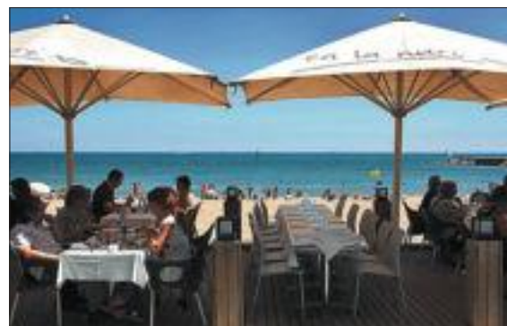
La terraza de Ca la Nuri.

Desaparecidos los clásicos chiringuitos barceloneses por una arbitraria ley de costas, y si no, sólo hay que visitar algunos paraísos de la Costa Brava convertidos en Eldorado de ayuntamientos y constructores, la nueva generación de restaurantes playeros barceloneses lo tuvo difícil para instalarse en el corazón ciudadano y convertirse en parte de la postal de la nueva Barcelona balnearia. Uno de los restaurantes que han calado en el estómago de los barceloneses es Ca la Nuri, local que también tiene su versión urbana en el barrio del Eixample. La base fundamental del arraigo de Ca la Nuri en la ciudadanía es la comida. Cuando un restaurante está respaldado por un marco tan idílico, suele dejarse las carnes flácidas y hace de su carta un bodegón de productos muertos. Éste