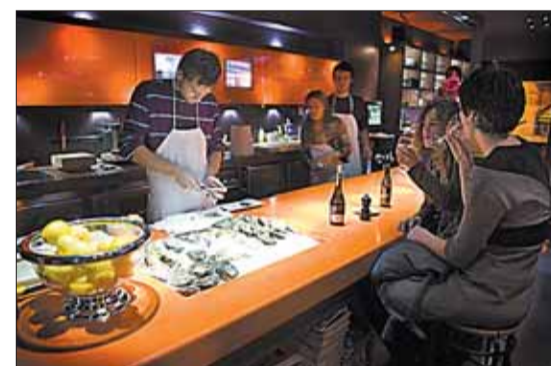
Restaurante Gouthier.

De la Gouthier número 3 dice que su sabor le recuerda el primer baño marino después del frío invierno. Y no se equivoca, aunque en mi memoria el cuadro de fondo son las islas Medes, tengo siete años y trato de sortear las cagadas de las gaviotas. De las ostras que ofrece Thierry las hay más inten-