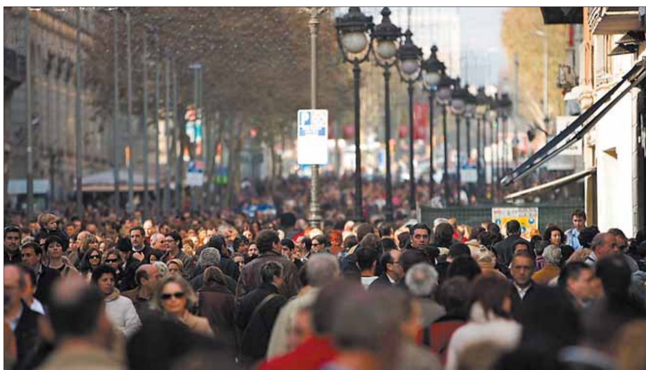
Palabras de la calle, frases improvisadas sobre la marcha. Cuando uno las caza al vuelo ve lo que no se veía.